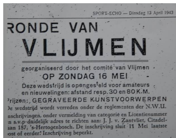
Oorspronkelijke aankondiging van de Ronde van Vlijmen in 1943, deze werd echter pas verreden op 23 augustus (Sport-Echo)

De eerste criterium Ronde van Vlijmen in 1941 werd met veel enthousiasme begroet. Het Noord Brabantsch Dagblad het Huisgezin pakte uit met een flinke voorbeschouwing en een nog groter verslag van de wedstrijd en al het randgebeuren. Er werd meer dan een halve pagina aan besteed. Of het de papierschaarste was of omdat de verhouding met de bezetter inmiddels aardig was bekoeld weten we niet, maar de volgende oorlogsronden kregen heel wat minder publiciteit. De belangstelling van rennerszijde bleef echter onverminderd. Wielrenners die een proflicentie hadden hoefden niet voor de 'Arbeitseinsatz', de tewerkstelling naar Duitsland. En dus waren er zelfs slimmeriken, die nog nooit op een fiets gereden hadden, die daarom maar beroepsrenner werden! Ook het publiek bleef massaal de wedstrijden bezoeken. In 1942 werden er zoveel premies uitgelooft, dat alle uitlooppogingen gedoemd waren te mislukken. De Bosschenaren Tonny van den Dungen en Frans Vos deden erg hun best om aan het peloton te ontsnappen, maar zonder succes.