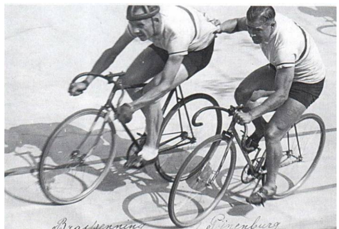
Programmaboekje van de zesdaagse van Brussel 1932, waarin de winnaars in 145 uur maar eventjes 3656 km. aflegden! (part.coll.)