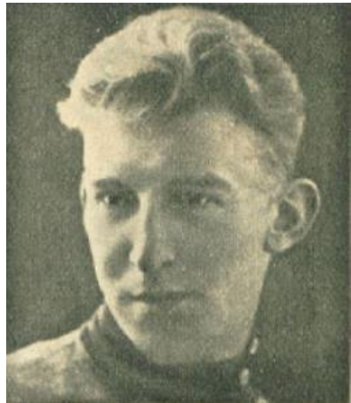
Jan van der Heijden, "de Witte" (1907) Nederlands kampioen weg amateurs 1927