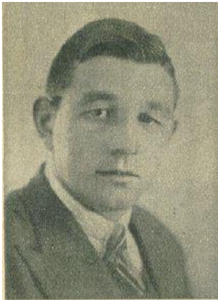
Janus Hellemons (1912 – 1972) Nederlands kampioen weg 1939 Tour de France 55 e 1938 46 e 1939