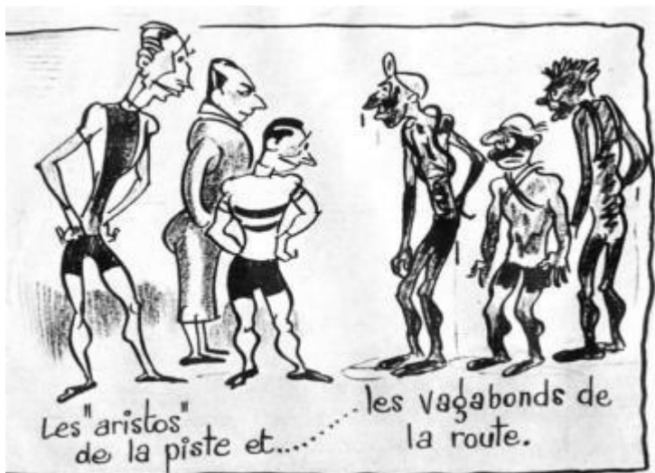
Tekening van de Franse cartoonist Pellos

Nederland heel veel wielervedetten kent heeft.